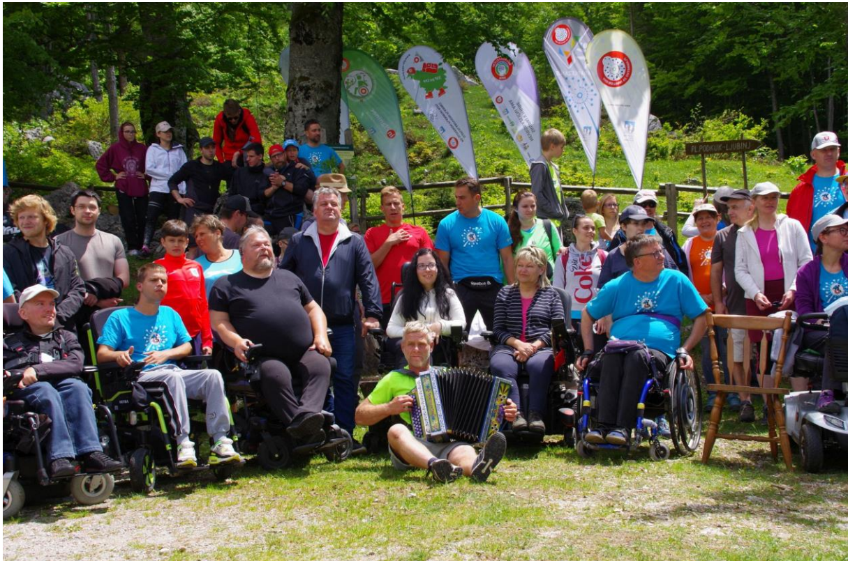
Skupinska slika na planini Razor

V družbi, ki je postala po razmišljanju zelo individualistična, take akcije krepijo odgovoren odnos do narave, v kateri je množica enkratnih in zanimivih posebnosti. Potrebno je odpreti oči in srce. Samo na ta način bomo začutili moč narave, ki nas lahko okrepi za lažje sprejemanje težav, ki nam jih je naložila bolezen in invalidnost."